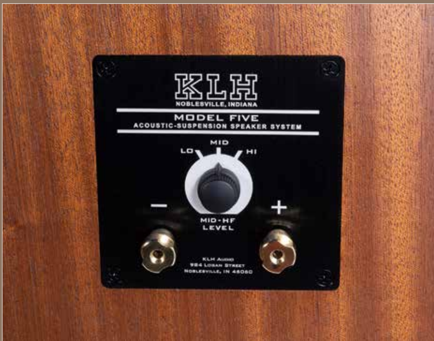
Der Drehschalter passt die Wiedergabe der Frequenzen über 400 Hz an. Somit lässt sich der Klang je nach Raum optimieren

systemen. Geschlossene Gehäuse sind gemeinhin bekannt für ihren genauen, straffen Bass.