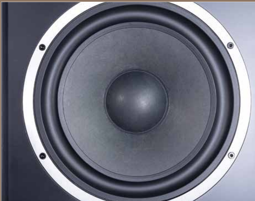
Der 25,4 cm große Kalottentieftöner besteht aus Zellstoff-Papier und hat eine umgekehrte Rollenaufhängung

Firmenlogo oder andere auffällige Akzente gibt es nicht. Das Gehäuse besteht aus einer 1,9 Zoll dicken, mitteldichten Faserplatte und ist in verschiedenen Varianten erhältlich. Es gibt drei Finishes: englische Walnuss, westafrikanisches Mahagoni und nordisches Noir. Das Gehäuse gefällt auf den ersten Blick und ist sehr wertig verarbeitet. Auf der Rückseite befindet sich neben dem ebenso