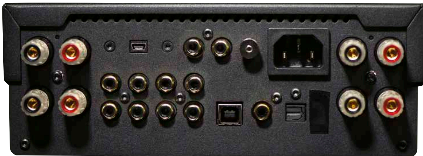
▲ Phono-MM, 32-Bit-DAC (PCM/DSD, USB, Coax, Toslink), Bluetooth und zwei Paar Lautsprecherausgänge machen den Coup perfekt.

Der kleine Cyrus kann aber offenbar tatsächlich selbst Lasten an die Kandar nehmen, an denen weitaus größere Verstärker – aller Funktionsklassen – mitunter wenig Land sehen. In Watt Ausgangsleistung reden wir beim Cyrus ONE HD von stattlichen knapp 100 an acht und über 160 an vier Ohm, für die kurzfristige Impulsverarbeitung werden gar über 200 Watt mobilisiert. Dass Watt nicht gleich Watt bedeutet, kann man sich aber immer wieder dadurch klarmachen, dass die Einheit Watt immer noch das Produkt aus Spannung (Volt) und Stromstärke