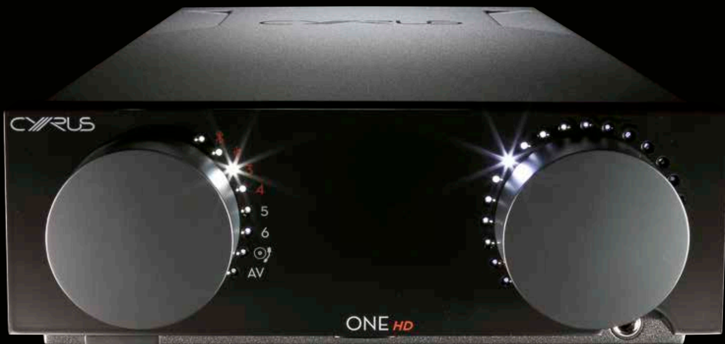
▲ Das nahezu symmetrische, extrem aufgeräumte Design des Cyrus ONE ist aus unserer Sicht ein veritabler Hingucker.

Freilich versteht der ONE auch gebräuchliche Fernbedienungs-codes, ist also gegebenenfalls auf eine Universalfernbedienung gut zu sprechen. Um weitere Fragen, die auch wir stellten, gleich abzufangen: Nein, es wird keinen passenden konventionellen Player (z. B. CD) zum ONE (HD) geben. Man sieht das sehr universelle ONE-Konzept als Alternative zu den spezialisierten Baustein-Systemen, für die Cyrus bekannt ist. Zudem bleiben beide ONE-Verstärkerversionen